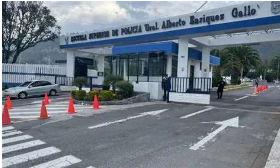
Escuela Superior de Policía "Gral. Alberto Enríquez Gallo"

Localización: Av. Manuel Córdova Galarza, Quito 170120